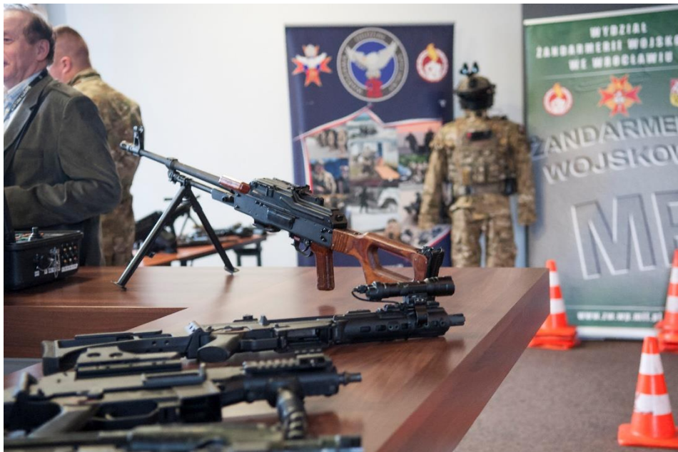
Zdj. 2. Prezentacja uzbrojenia OSŻW, OŻW w Żaganiu oraz SPAP KWP Wrocław.

Instytucjonalnie Konferencję wspierali w tym roku: Komenda Wojewódzka Policji we Wrocławiu, Oddział Żandarmerii Wojskowej w Żaganiu oraz Wydział ŻW we Wrocławiu, Komenda Wojewódzka Państwowej Straży Pożarnej we Wrocławiu, Polskie Sieci Elektroenergetyczne S.A., Związek Banków Polskich, Polska Izba Systemów Alarmowych, Polska Izba Ochrony, Polska Organizacja Handlu i Dystrybucji oraz UTC Fire & Security oraz Polskie Towarzystwo Bezpieczeństwa Narodowego.