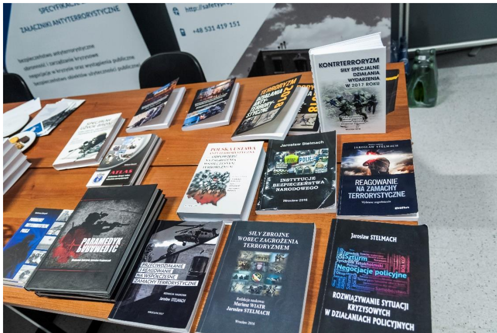
Zdj. 4. Prezentacja literatury tematycznej na jednym ze stoisk partnerów wydawniczych.

można było się zapoznać także z pojazdami, sprzętem oraz wyposażeniem specjalistycznym policyjnych oraz wojskowych sił specjalnych z Oddziału Specjalnego Żandarmerii Wojskowej oraz Samodzielnego Pododdziału Antyterrorystycznego Policji we Wrocławiu. Ponadto Żandarmeria Wojskowa udostępniła uczestnikom symulator zderzeń drogowych oraz symulator jazdy 3D, gdzie każdy mógł zaprezentować oraz doskonalić swoje umiejętności prowadzenia pojazdów. Przez kilka godzin odbywała się również prezentacja ambulansu kryminalistycznego Żandarmerii Wojskowej.