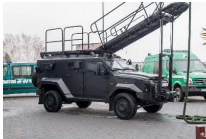
Zdj. 7. Prezentacja sprzętu specjalistycznego ŻW oraz SPAP KWP Wrocław.