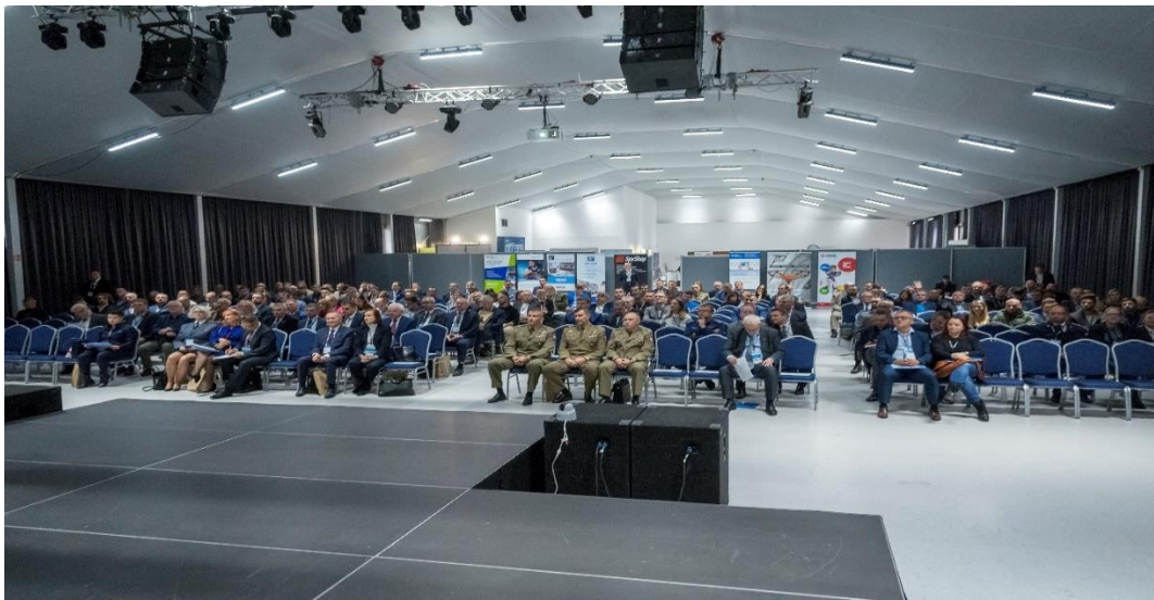
Zdj. 5. Uczestnicy Kongresu.

skłoniły do refleksji nad potrzebą wzmocnienia ochrony tychże budynków – szczególnie centrów handlowych czy szkół oraz uczelni wyższych. Do tego zarysowała się potrzeba dyskusji nad możliwościami usprawnienia jakości usług polskiego sektora ochrony osób i mienia, z podkreśleniem, że firmy mogą dostarczać usługi ochrony na znacznie wyższym poziomie ale wymaga to wydatkowania większej ilości środków przez zarządzających tymi obiektami. Znaczna liczba pytań i wniosków podczas obrad udowodniła, że wiele tematów wymaga jeszcze pogłębienia i wypracowania wspólnych rekomendacji, które powinny zostać przedstawione na poziomie decyzyjnym instytucjom bezpieczeństwa narodowego. Niewątpliwym atutem tegorocznego spotkania naukowo-praktycznego była liczba ponad trzystu uczestników, co udowadnia, że wśród zarządzających bezpieczeństwem istnieje wysoka świadomość oraz potrzeba poszerzania wiedzy i kompetencji z zakresu bezpieczeństwa antyterrorystycznego.