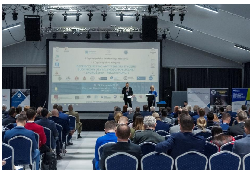
Zdj. 1. Uroczyste otwarcie Kongresu.

W dniach 21-22 listopada 2018 roku we wrocławskim Centrum Kongresowym Hotelu Terminal odbyła się II Ogólnopolska Konferencja Naukowa – I Ogólnopolski Kongres pt. Bezpieczeństwo antyterrorystyczne budynków użyteczności publicznej – wyzwania i rekomendacje. Przedsięwzięcie zostało zorganizowane przez Zakład Socjologii Edukacji Instytutu Socjologii Uniwersytetu Wrocławskiego, Katedrę Kryminologii i Nauk o Bezpieczeństwie Wydziału Prawa, Administracji i Ekonomii Uniwersytetu Wrocławskiego, Wyższą Szkołę Bezpieczeństwa Publicznego i Indywidualnego Apeiron w Krakowie oraz wspierane było logistycznie przez firmę szkoleniową Safety Project.